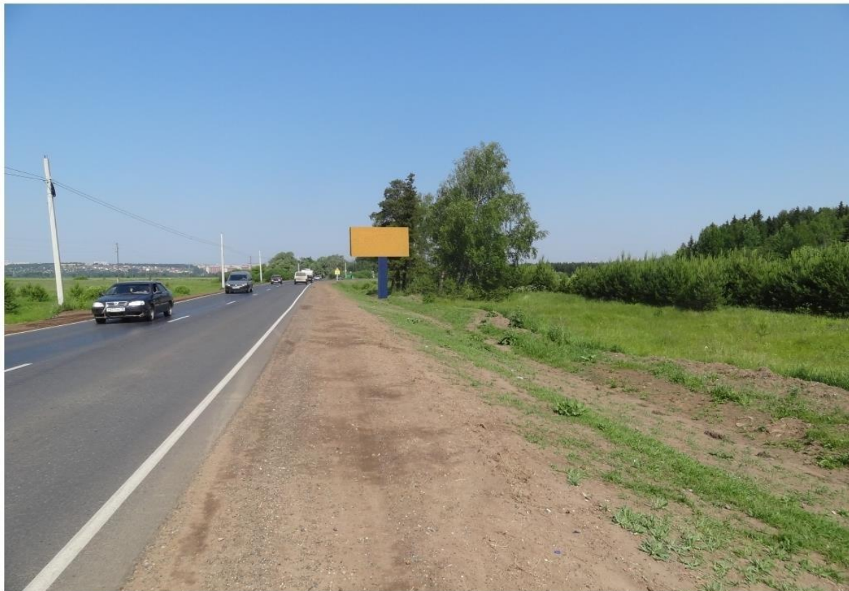
16. МО «Завьяловское», с. Завьялово, автодорога Завьялово – Гольяны, км 1+380, справа – РК 1.26