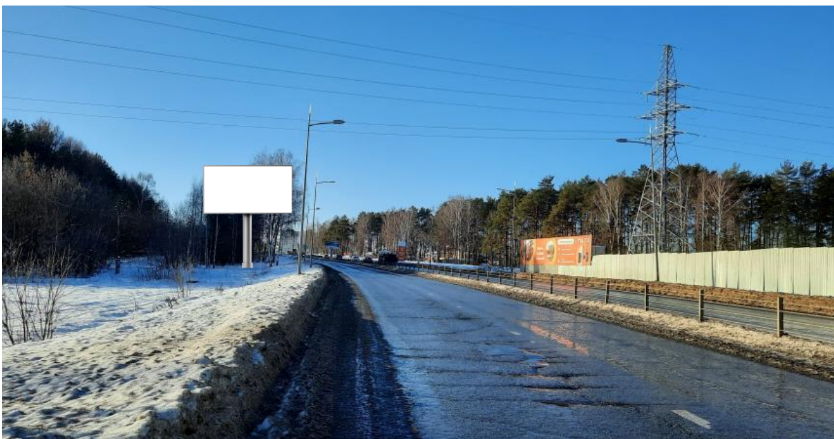
26. МО «Октябрьское», с. Октябрьский, автодорога Ижевск-Аэропорт, км 7+980, слева – РК 7.1