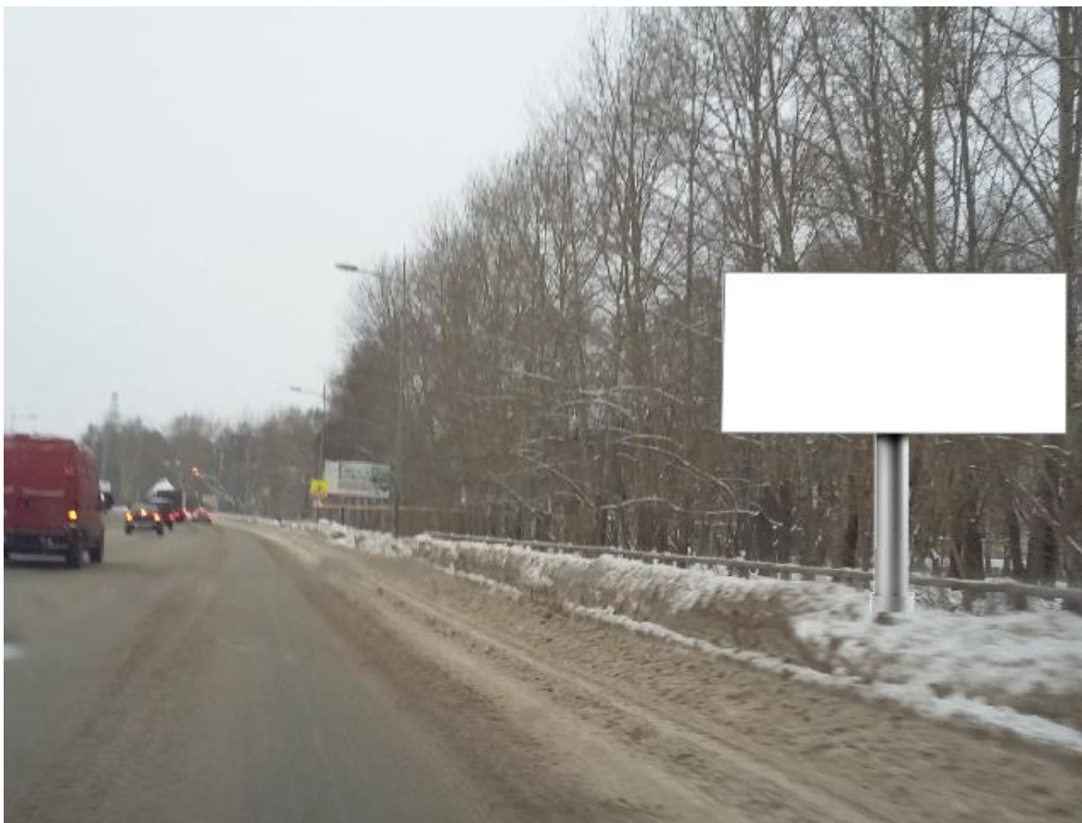
24. Завьялово, автодорога (Ижевск-Аэропорт) - Завьялово, км 2+450, справа, у поворота на ул. Колхозную – РК 1.35