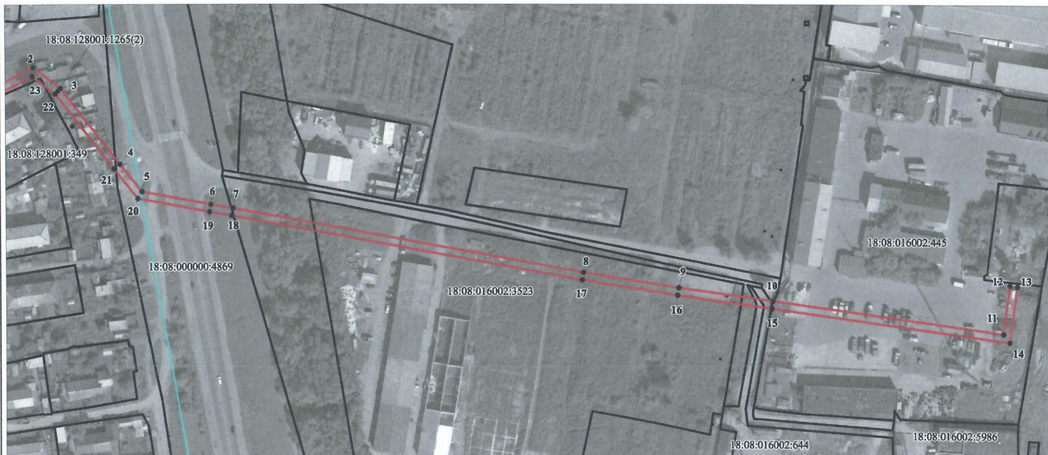
План границ объекта Выносной лист 2

Публичный сервитут для размещения объекта газораспределительной сети с кадастровым номером 18:08:000000:5388, расположенный по адресу: Удмуртская Республика, Завьяловский район, от ГРС-1 по ул. Северной до котельной СХПК "Ижевский" Завьяловский район, дер. Пирогово, ул. Северная, 18