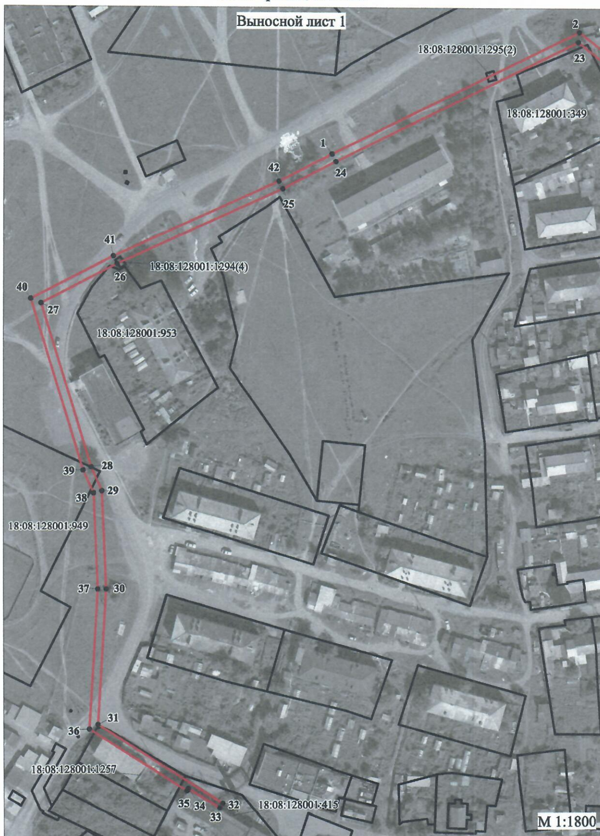
План границ объекта

Используемые условные знаки и обозначения приведены на отдельной странице в конце плана