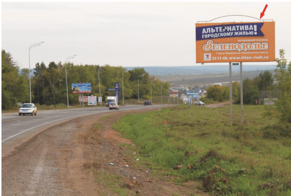
наименование Отдельстоящая щитовая двухсторонняя конструкция, р-ром 3х6м 163 км + 795 слева макет утвержден ДАТО