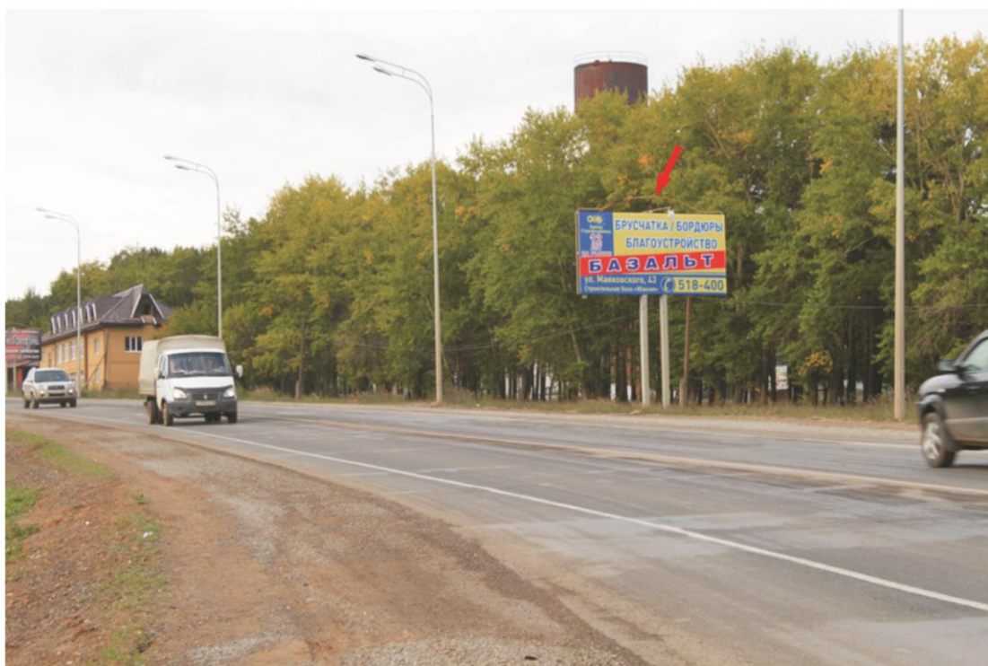
наименование Отдельстоящая щитовая двухсторонняя конструкция, р-ром 3х6м 163 км + 760 справа макет утвержден ДАТО