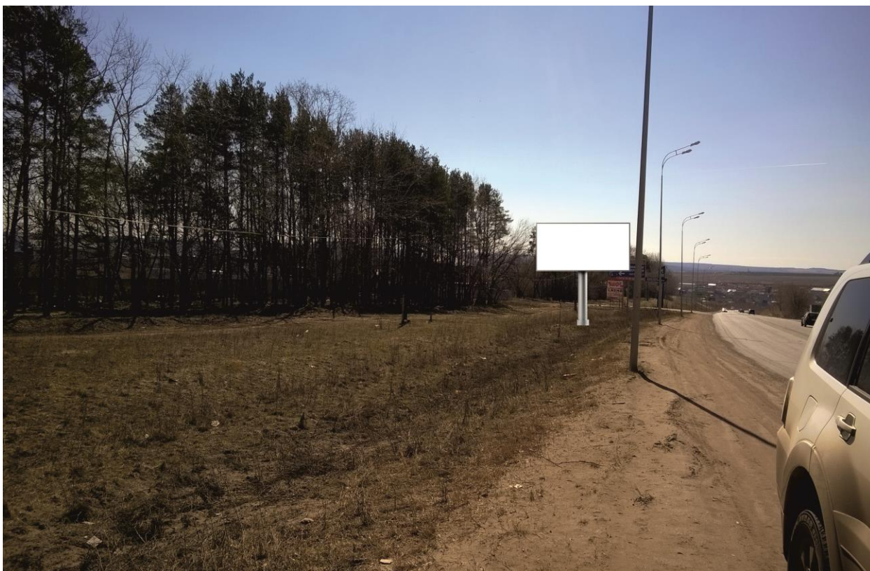
6. МО «Пироговское», д. Пирогово, автодорога М-7 Волга, км 163+650 – РК 1.6