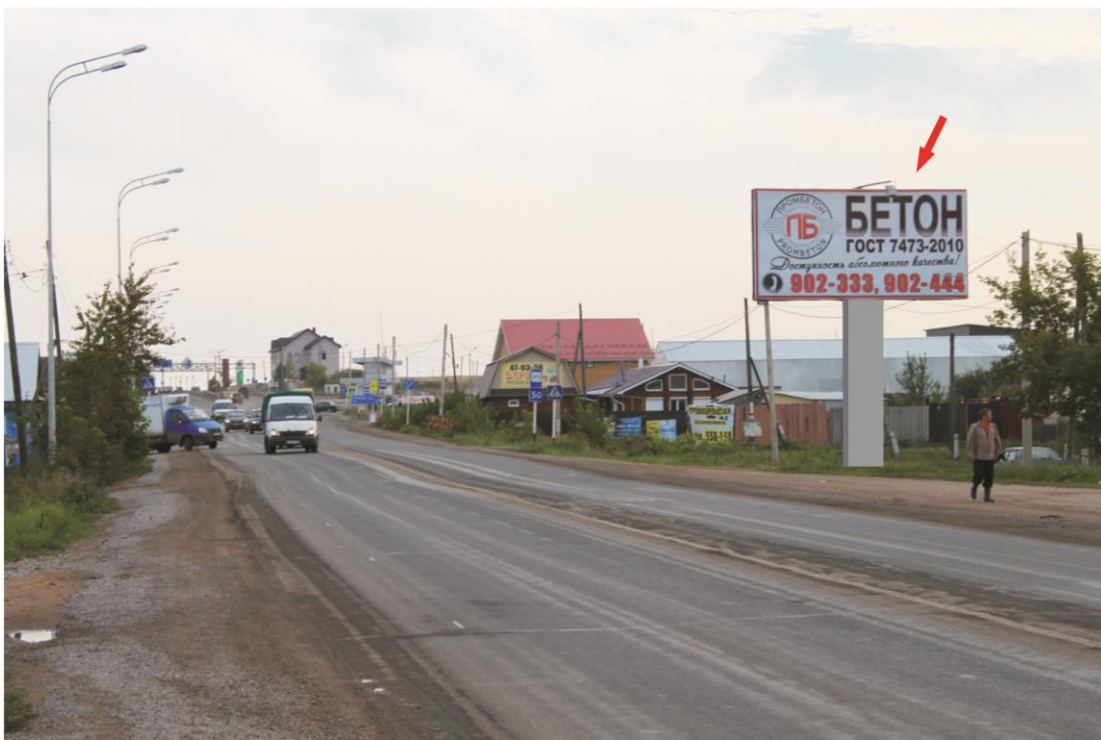
14. МО «Пироговское», д. Пирогово, автодорога М-7 Волга, км 162+590 – РК 1.14

наименование Отдельстоящая щитовая двухсторонняя конструкция, р-ром 3х6м 162 км + 740 слева макет утвержден дата