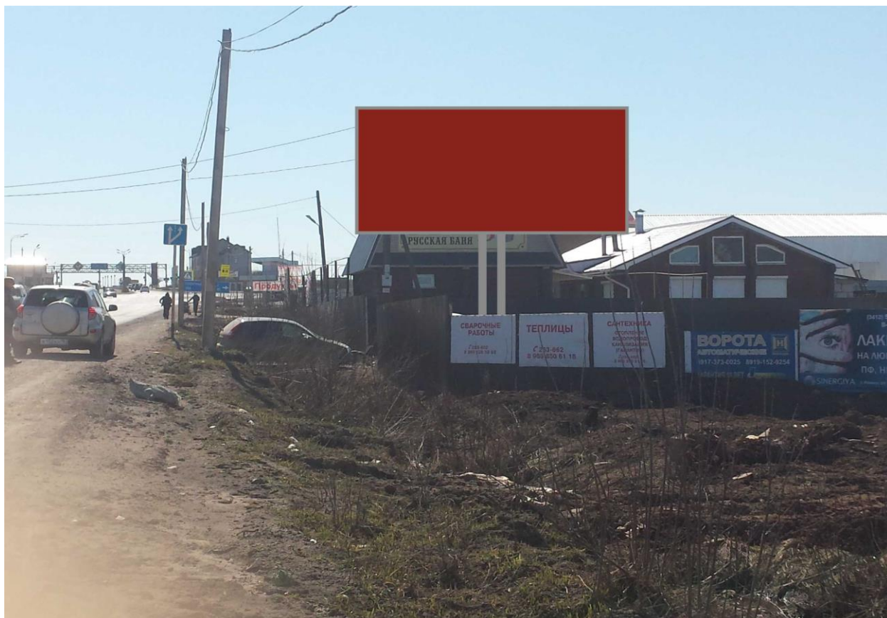
16. МО «Пироговское», д. Пирогово, автодорога М-7 Волга, км 163+130 - РК 1.16